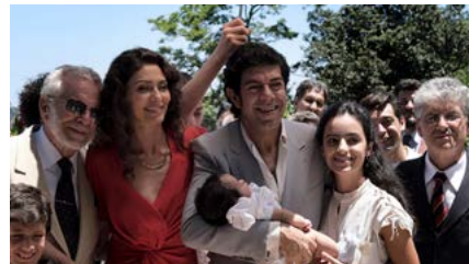
Kliknij, aby pobrać zdjęcie