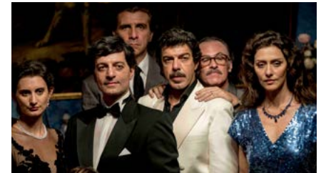
Kliknij, aby pobrać zdjęcie