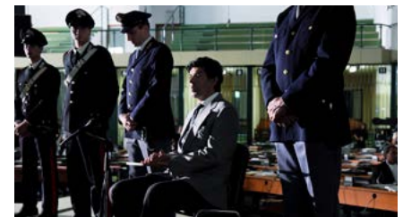
Kliknij, aby pobrać zdjęcie