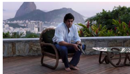
Kliknij, aby pobrać zdjęcie