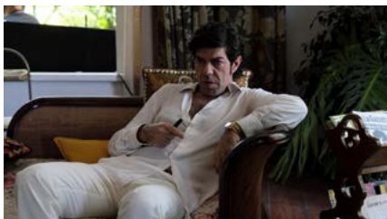
Kliknij, aby pobrać zdjęcie