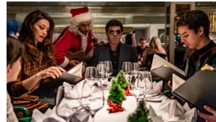
Kliknij, aby pobrać zdjęcie