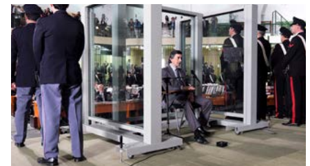
Kliknij, aby pobrać zdjęcie