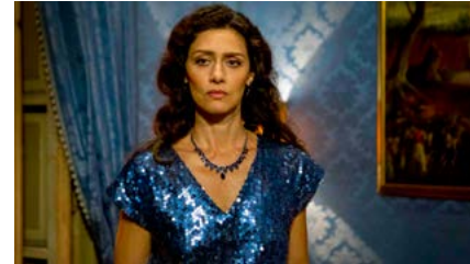
Kliknij, aby pobrać zdjęcie