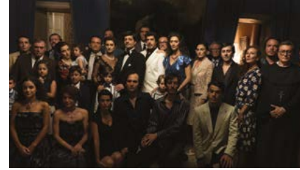
Kliknij, aby pobrać zdjęcie