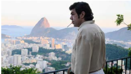
Kliknij, aby pobrać zdjęcie