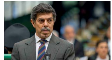
Kliknij, aby pobrać zdjęcie