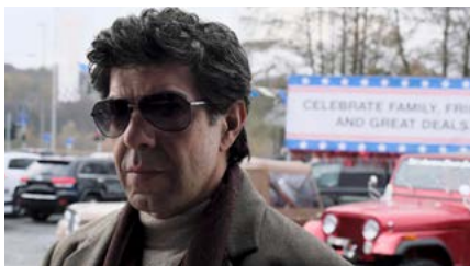
Kliknij, aby pobrać zdjęcie