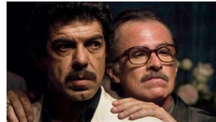
Kliknij, aby pobrać zdjęcie